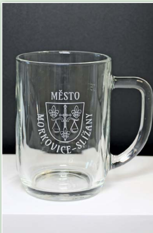
Pivní púllitr s uchem s pískovaným znakem a názvem města 150,- Kč