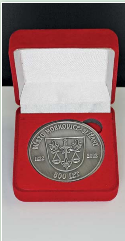
Pamětní mince ražená oboustranná + sametová krabička 400,- Kč