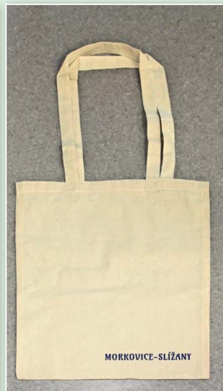
Bavlněná taška s nápisem Morkovice-Slížany 60,- Kč