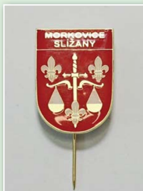
Kovové odznaky na jehle 25,- Kč