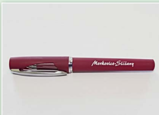
Pamětní pero s názvem města 20,- Kč